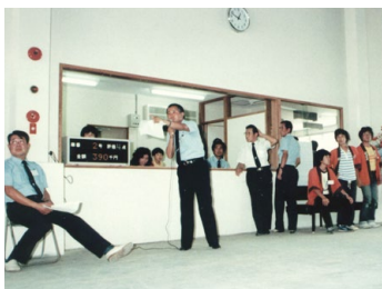
第1回オートオークション

1982年8月 愛知県東海市に常設現車会場名古屋会場オープン。 出品台数255台で第1回オートオークション開催。