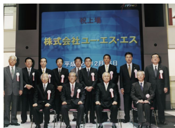
株式上場記念(東京証券取引所市場第一部)