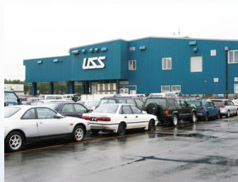
オープン当時の札幌会場