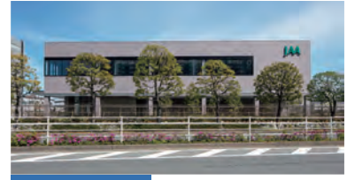
オートオークション 2021年10月