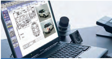
オートオークション 2005年10月