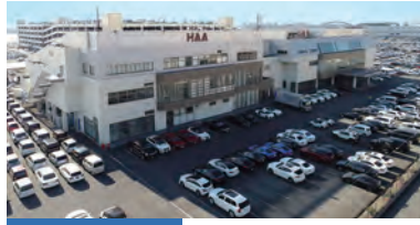
オートオークション 2018年3月