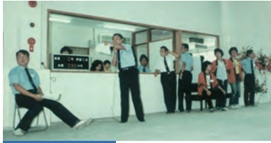
オートオークション 1982年8月