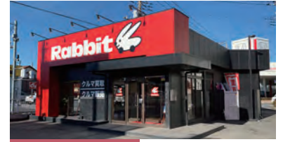
中古自動車等買取販売 2001年10月